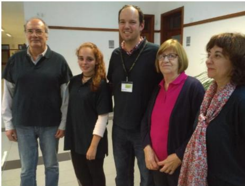
A equipa organizadora do seminário da APPI na Região.

Desde outubro, a APPI, em parceria com outras estruturas profissionais ligadas ao ensino e demais sociedades científicas, tem vindo a analisar a questão do reajustamento curricular. Um trabalho desencadeado a convite da Secretaria de Estado da Educação e que se centra em duas vertentes: “emagrecer” os atuais currículos e definir as chamadas aprendizagens essenciais a constar do currículo do século XXI, em linha com as exigências e competitividade da sociedade atual.