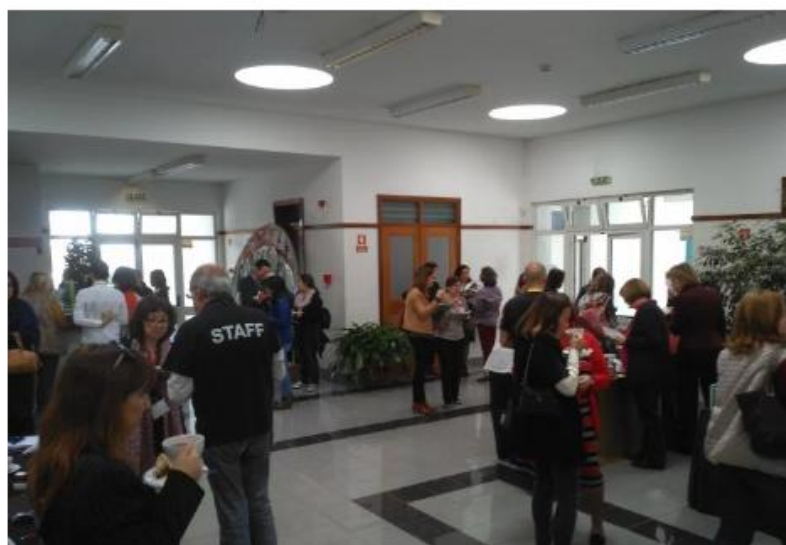
A pausa para o chá e scones fez parte do encontro de professores de Inglês.